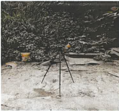
厂界北侧噪声监控点 5#