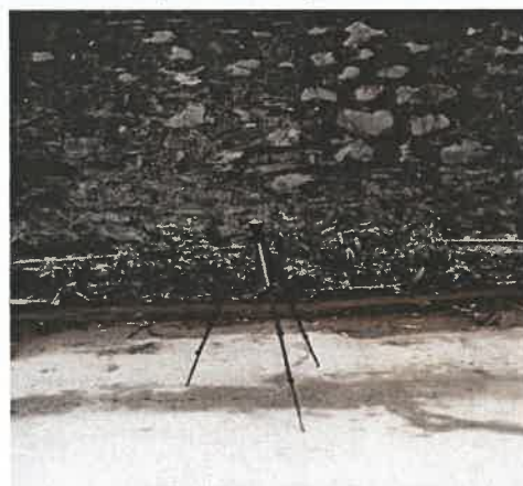
厂界东侧噪声监控点 1#