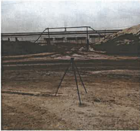
厂界西侧噪声监控点 3#