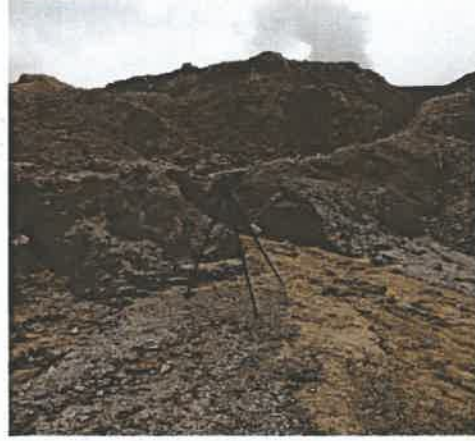
厂界西侧噪声监控点 4#