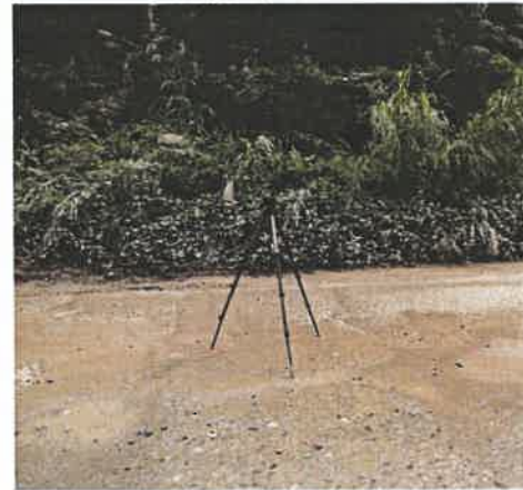
厂界南侧噪声监控点 2#